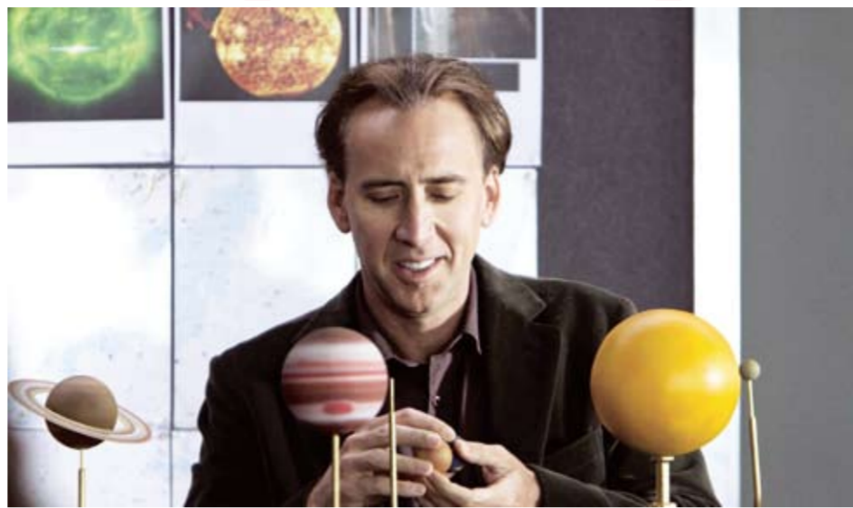
Кадр из фильма «Знамение»

Фильм «Тринадцатый район» снят режиссером Патриком Алессандроном. В ролях – Сирил Раффаэли, Дэвид Белль, Филипп Торретон, Даниэль Дюваль, Элоди Юнг. В 2010 году преступность на окраинах Парижа увеличилась, и правительство решает построить высокую непробиваемую стену. Но предпринятая мера оказалась абсолютно неэффективна, и теперь у бандитских группировок фактически появился свой форт, проникнуть в который не так просто. Разобраться с этой критической ситуацией помогают опытный спецназовец Дэмиан и его энергичный напарник, бывший мошенник Лейто. Они успешно ликвидировали лидеров преступной банды. Прошло время, а бандиты не собираются сдаваться. И теперь даже дети берут в