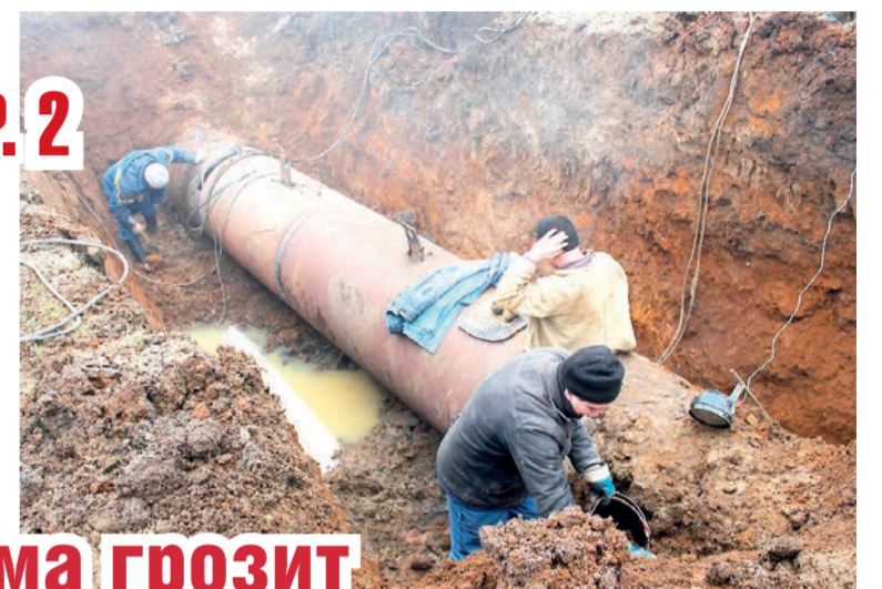
➔ СТР. 2

В результате ночного ЧП движение трамваев в Пятигорске в утренние часы 16 октября оказалось полностью парализованным одновременно в нескольких микрорайонах города. Ветки на деревьях под воздействием сильных порывов северо-западного ветра ломались и падали на электропровода трамвайных линий.