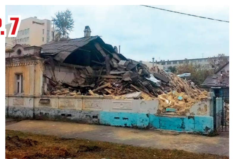
➔ СТР. 7

Судом удовлетворены требования прокурора об обязанности администрации Пятигорска привести улично-дорожную сеть в соответствие с законодательством о безопасности дорожного движения.