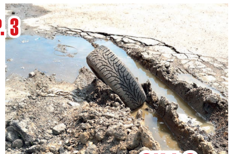
➔ СТР. 3

Начался отопительный сезон, в многоквартирные дома и учреждения, наконец, дали тепло. Но изношенность водопровода в столице СКФО приводит к частым авариям на теплотрассах и порывам водопроводных труб. Ситуация может стать критической.