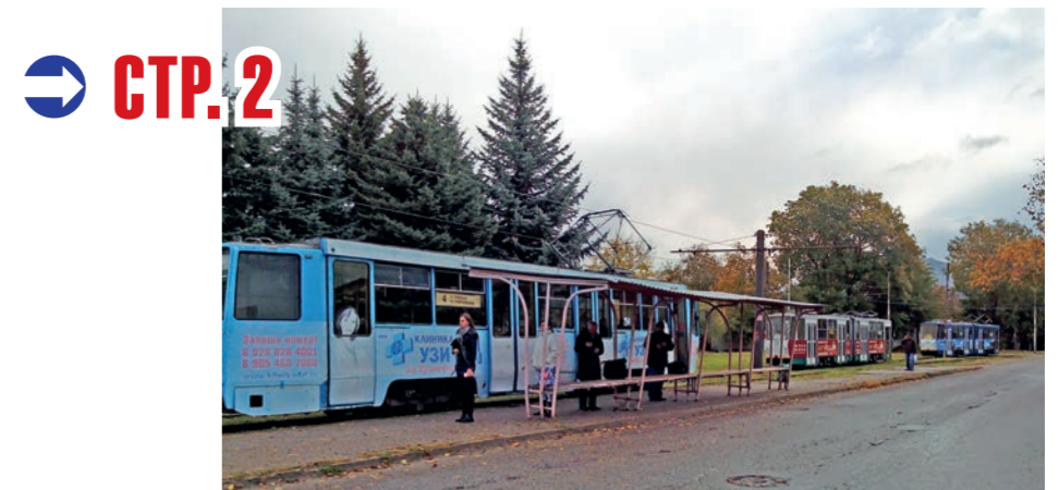
➔ СТР. 2