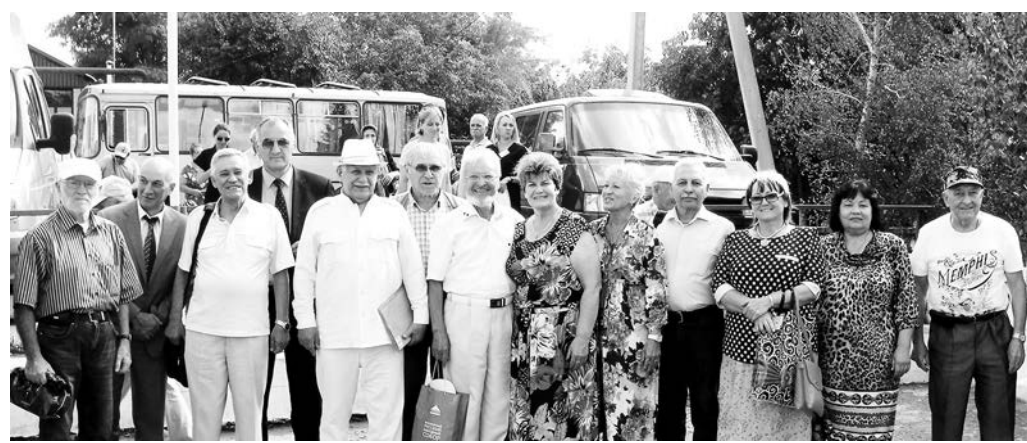
Ставропольское краевое отделение Союза писателей России провело в Курском районе второй Межрегиональный фестиваль поэзии народов Северного Кавказа «Родники вдохновения».