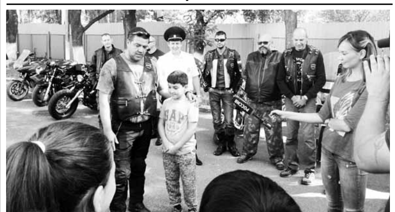
Сотрудники Госавтоинспекции совместно с мотоклубом «Ворон» и детьми школы № 14 Пятигорска провели открытый урок безопасного поведения на дороге. Большое внимание было уделено разъяснению конкретных ситуаций.