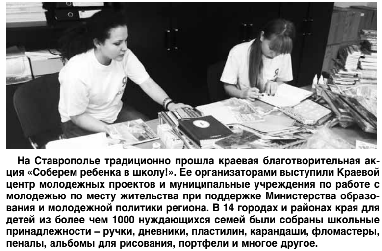
На Ставрополье традиционно прошла краевая благотворительная акция «Соберем ребенка в школу!». Ее организаторами выступили Краевая центр молодежных проектов и муниципальные учреждения по работе с молодежью по месту жительства при поддержке Министерства образования и молодежной политики региона. В 14 городах и районах края для детей из более чем 1000 нуждающихся семей были собраны школьные принадлежности – ручки, дневники, пластилин, карандаши, фломастеры, пеналы, альбомы для рисования, портфели и многое другое.