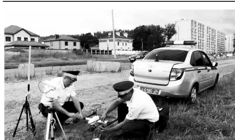
Ставропольский край – стал первым в России регионом, где за дорожным движением с воздуха осуществляет надзор квадрокоптер.