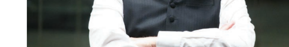
Энтони Хопкинс в сериале «Мир Дикого Запада»

Стоит сказать несколько слов и об исполнителе главной роли в сериале «Мир Дикого Запада» Филипе Энтони Хопкинсе. Будущий британский и американский актер театра и кино, кинорежиссер, композитор родился в 31 декабря 1937 года в Уэльсе. Наибольшую известность ему принес кинематографический образ серийного убийцы-каннибала доктора Ганнибала Лектера, воплощенный в фильмах «Молчание ягнят», «Ганнибал» и «Красный