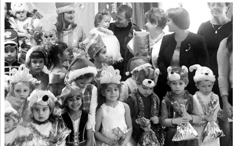
Новогодние елки для ребятшек провели многие казачьи общества Ставрополя.

Кроме того, казачи всех подразделений окружной казачьей дружины и в составе народных дружин вместе с сотрудниками полиции обеспечивали охрану общественного порядка и безопасность жителей края во время новогодних и рождественских праздников.