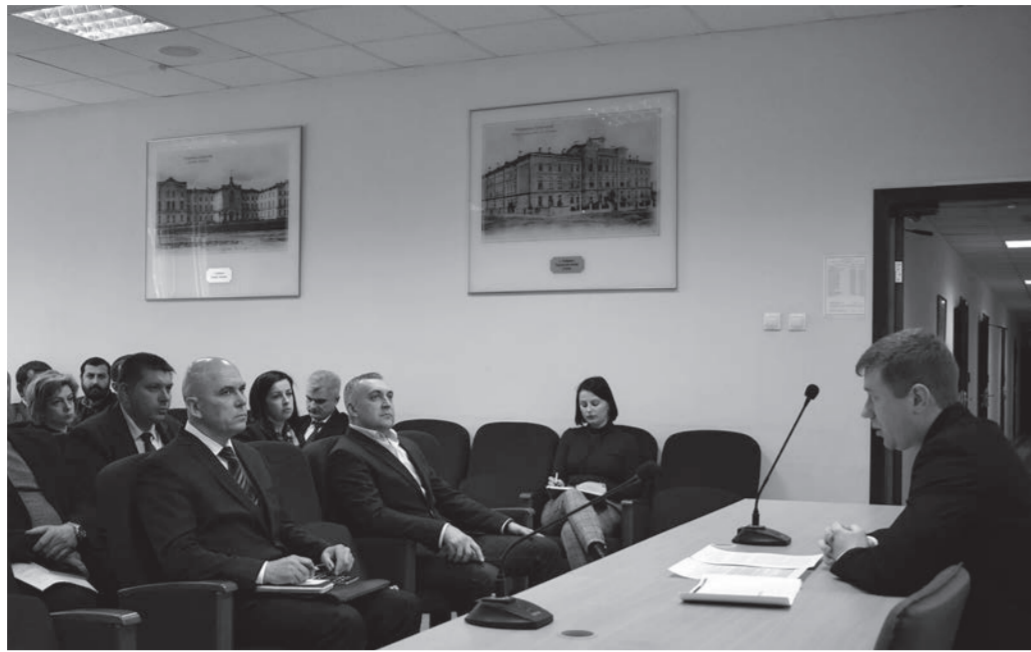
До 1 мая в крае пересчитают действующие объекты водоснабжения и оценят качество воды, подаваемой населению. Работа проводится в рамках федерального проекта «Чистая вода».